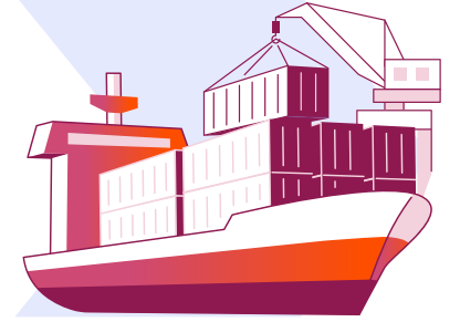
Nihai alıcılar (deniz taşımacılığında)